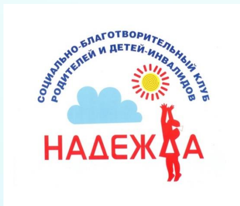
Социально-благотворительный клуб родителей и детей-инвалидов «Надежда»