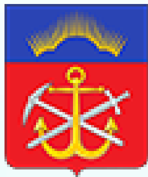
Правительство Мурманской области