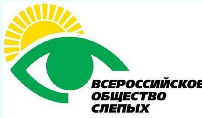
Региональное отделение «Всероссийское общество слепых» в Мурманской области