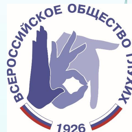
Региональное отделение «Всероссийское общества глухих» в Мурманской области