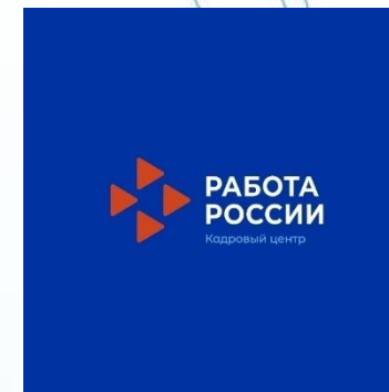
Центр занятости населения Мурманской области