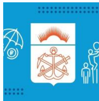
Министерство труда и социального развития Мурманской области