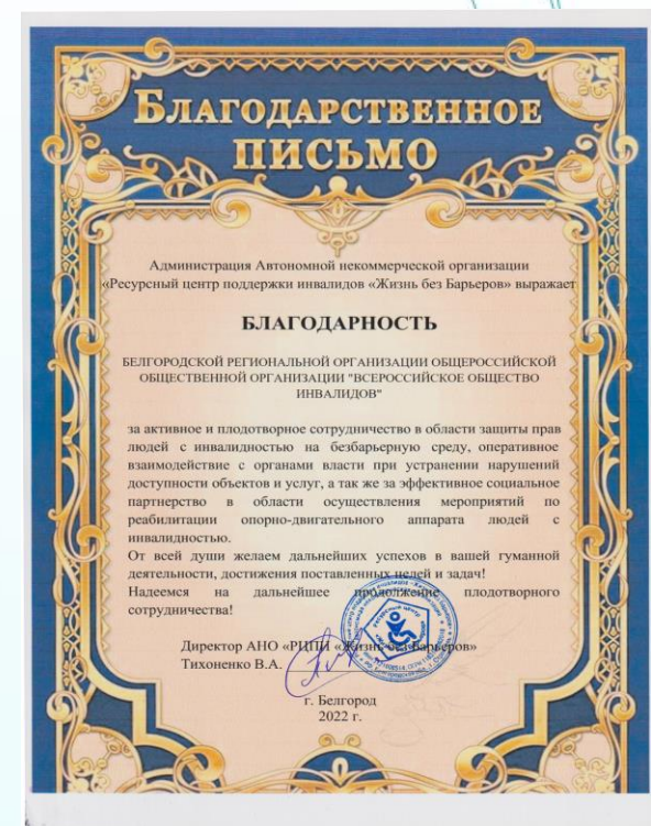
АНО РЦПИ «Жизнь без барьеров»