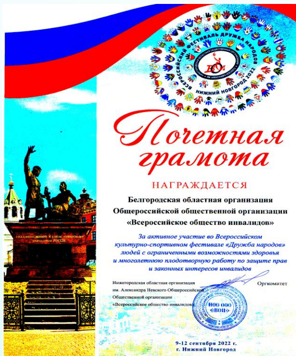
Нижегородская областная организация им. А.Невского общероссийской общественной организации ВОИ