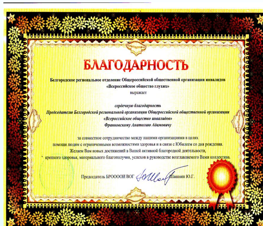
Белгородская региональная организация общероссийской общественной организации ВОГ